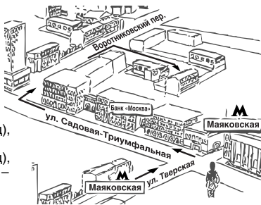
Схема расположения Центра технического обслуживания «СиЭс Медика»

Часы работы Центра технического обслуживания «СиЭс Медика»: пн-пт: с 09.30 до 19.00 (без перерыва на обед), сб: с 10.00 до 18.00 (без перерыва на обед), вс и праздничные дни – выходной